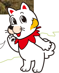
広島広域都市圏マスコットキャラクター ひろしま都市犬はっしー

広島広域都市圏とは、広島市の都心部からおおむね60kmの圏内にある、東は三原市エリアから西は山口県柳井市エリアまでの25市町のことだワン。圏域内の活性化と人口200万人超の維持を目指しているんだワン。