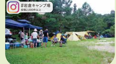
#岩倉キャンプ場 投稿2,000件以上

釣ったアマゴはシンプルに塩焼きがおすすめです。溪流釣りや池釣りなど、様々なシステムから選べるアマゴ釣りもお楽しみください。 【問】0829-72-1446(あまご屋(七瀬川溪流釣り場))