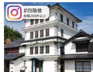
#四階楼 投稿200件以上

標高314.7mの山頂にある展望台からは360度のパノラマが楽しめます。 晴れた日には遠く四国佐田岬や九州の国東半島が望めます。 【場所】山口県熊毛郡上関町長島10071番地 【問】0820-62-0360(上関町役場産業観光課)