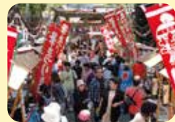
榊山神社での筆まつり

江戸時代後期から受け継がれてきた伝統的な手法で作られる 日本一の「筆」の産地として知られる町です。