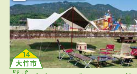
#晴海臨海公園デイキャンプ場 投稿100件未満

サザエ、アナゴ、タコなど、目の前まで獲れた旬の魚介が絶品です。一週間前までに電話でご予約ください! 【問】0820-58-0221(山口県漁業協同組合平生町支店)