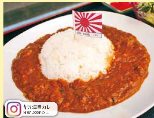
#呉海自カレー 投稿1,000件以上