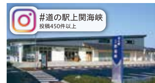
#道の駅上関海峡 投稿450件以上

1879(明治12)年に竣工された四階建て 擬洋風木造建築で国重要文化財に指定 されています。 【場所】山口県熊毛郡上関町室津868番地1 【時】10:00～17:00 【休】月曜日(祝日の場合翌日) 【問】0820-62-6040(郷土史学習館)