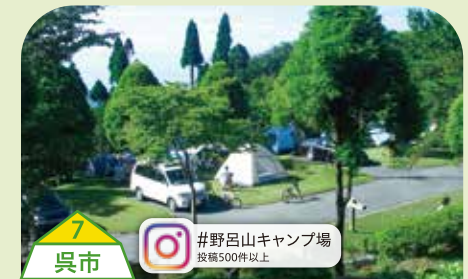
7 呉市 #野呂山キャンプ場 投稿500件以上