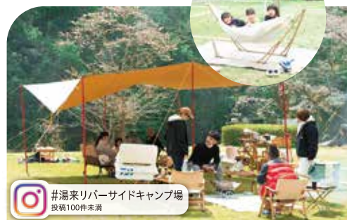
#湯来リバーサイドキャンプ場 投稿100件未満