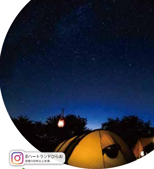
#ハートランドひろお 投稿100件以上未満

「道の駅サザンせとうわ」で販売中です。他にも東和金時(さつまいも)など旬の食材がたくさん! 焼きジャムやオイルサーディンもおすすめです。 【問】0820-78-0033 (道の駅サザンせとうわ)