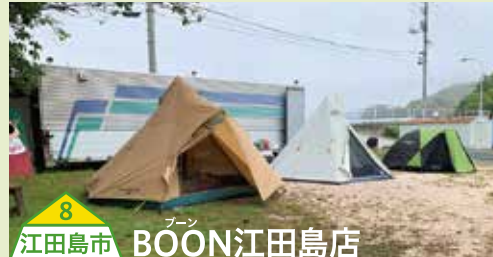
8 江田島市 BOON江田島店

水道、トイレ完備なので、初心者でも気軽にキャンプやBBQを楽しめます。近くには恐竜の森があり、子ども達の探検にも持ってこいです。 【料】テント持ち込み500円(1泊)、バーベキューセット(コンロ一式)500円(持ち込みの場合は300円)、休憩棟2,000円 【場所】山口県玖珂郡和木町大字瀬田紺屋作260-1 【問】0827-52-3751(蜂ヶ峯総合公園管理棟)