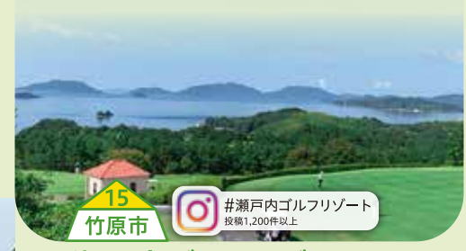
15 竹原市 #瀬戸内ゴルフリゾート 投稿1,200件以上

おすすめ食材「開だこ」 炙ってよし、タコ飯にしてよしの珍味。プリッととした歯ごたえでお子様にも人気です。 【購入先】0848-63-8585(道の駅みはら神明の里) 【製造元】(有)石田政造商店