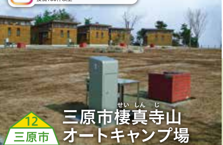
12 三原市 三原市棲真寺山 オートキャンプ場

広島空港を間近に望む棲真寺山山頂にあるオートキャンプ場です。その魅力は何といっても眼下に広がる瀬戸内海や、運かに四国連峰を一望できる眺めです。 【料】<テントサイト(1サイト)>宿泊4,000円、デイクース2,000円、超過時間500円(1時間)<ケビン(1棟)>宿泊10,000円、デイクース3,000円、超過時間1,000円(1時間) 【場所】広島県三原市大和町平坂10315-1 【問】0847-34-2750(三原市棲真寺山オートキャンプ場)