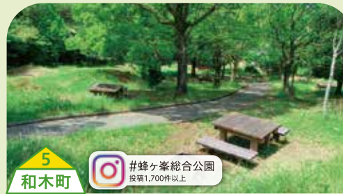
5 和木町 #蜂ヶ峯総合公園 投稿1,700件以上

湯来温泉にあるキャンプ場です。清流・水内川のほとりでキャンプと川遊びを楽しんだ後は、すぐ隣にある湯来ロッジで気軽に温泉に入ることができます。 【料】1区画5,000円(1泊)、デイクース1,500円(それぞれ湯来ロッジ入浴券付) 【場所】広島県広島市佐伯区湯来町多田2563-1 【問】0829-40-6016(湯来交流体験センター)