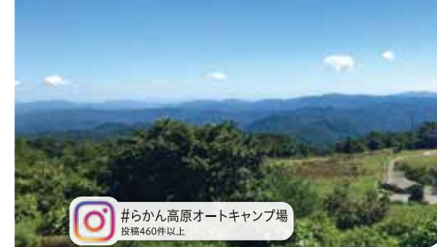
#らかん高原オートキャンプ場 投稿460件以上

プリッととした食感と、とろけるような深い味わい。生はもちろん、煮る・焼く・揚げると、蒸す・浸す、どれも絶品です!