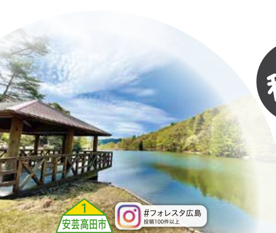
1 安芸高田市 #フォレスト広島 投稿100件以上