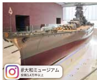
#大和ミュージアム 投稿3.4万件以上