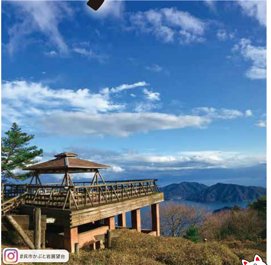
#呉市かぶと岩展望台