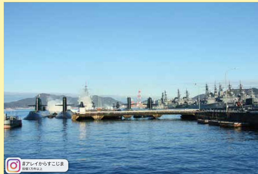
#アレイからすこじま 投稿1万件以上