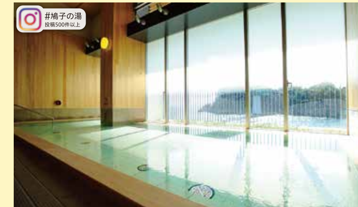
#鳩子の湯 投稿500件以上