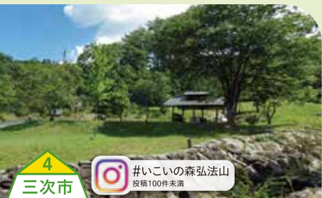
4 三次市 #いこいの森弘法山 投稿100件未満

コウネが広島だけなんて驚愕! 1頭から2kgしか取れない希少部位で、脂の甘みとコリコリの食感が絶品です! 【問】082-830-6677(株式会社アルディー)